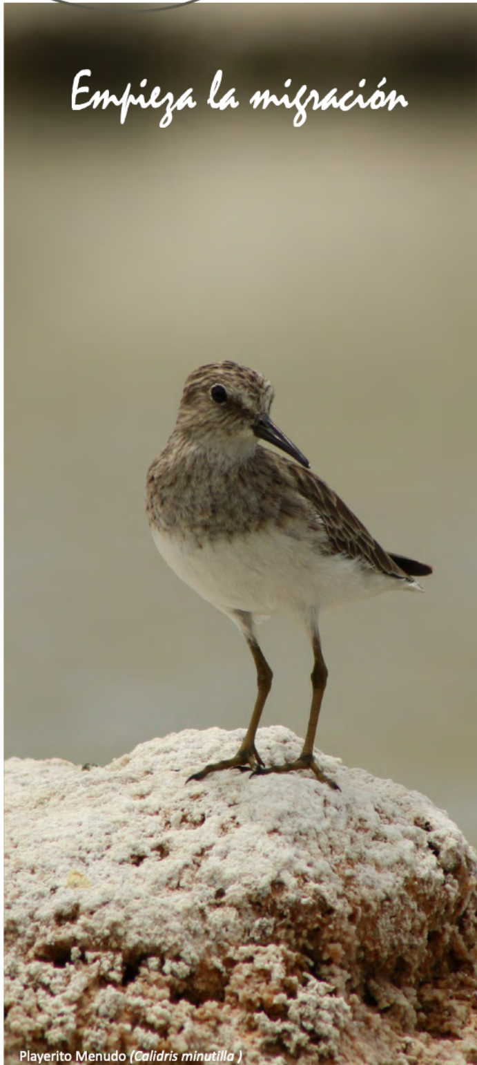
Playerito Menudo ( Calidris minutilla )