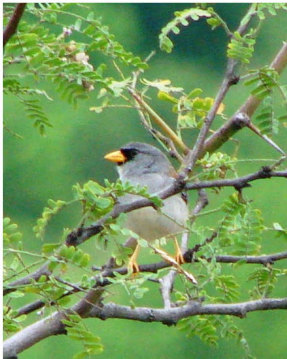
Figura 1: Individuo adulto de Gorrión Jaeno ( Incaeziza watkinsi ).

un relieve accidentado con acantilados de hasta más de 100 metros de altura y con quebradas (muchas de ellas temporalmente secas) (García-Bravo 2008).