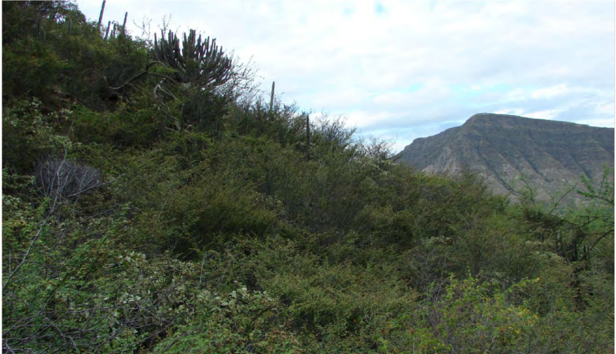
Figura 3: Vista típica del hábitat natural de Incaspiza watkinsi .

tróleo están ligados al deterioro ambiental y a la pérdida de la biodiversidad, principalmente por la contaminación y la deforestación. La contaminación se puede dar por el derrame del petróleo y de sus distintos componentes, por la detonación con explosivos y por la quema de gas. La deforestación se daría por la inundación producida por las represas, la prospección sísmica, la apertura de carreteras de acceso y por la construcción de plataformas, campamentos y helipuertos (Bravo 2007). Todas las actividades antes mencionadas fragmentarán y degradarán aún más el hábitat del Gorrión Jaeno y en general los BESVIM.